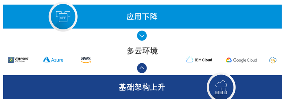
图 1: VMWARE TANZU 整个体系的现代化：应用和基础架构

进行现代化改造需要深入理解现代应用需要什么，以及运行企业级基础架构有哪些要求。VMware 在帮助全球规模最大的企业构建数字化业务的基础方面具有多年经验，可以帮助您开展可能对您而言最重要的工作：对您的应用进行现代化改造。VMware Tanzu 产品家族可实现整个体系的现代化，支持您实现团队和应用转型，同时跨多云基础架构简化软件运维。